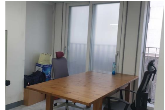
▲ 회의 공간