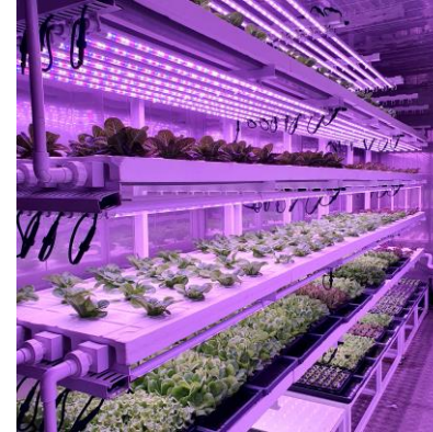
▲ 직영 농장