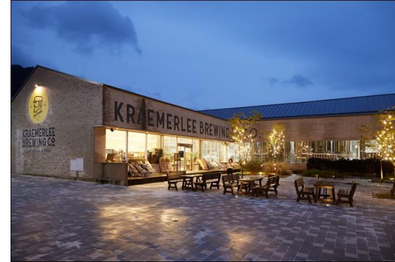
▲ 매장 전경