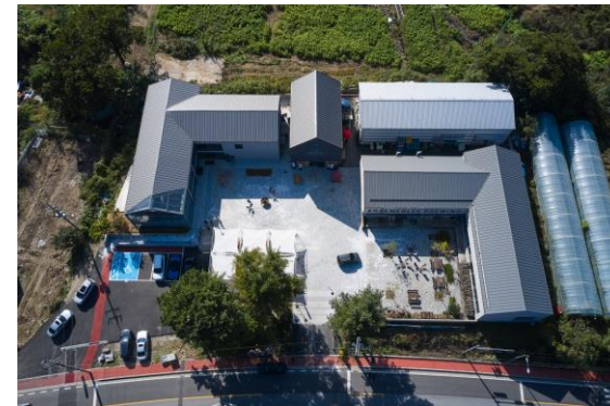
▲ 본사 사무실, 매장 구도