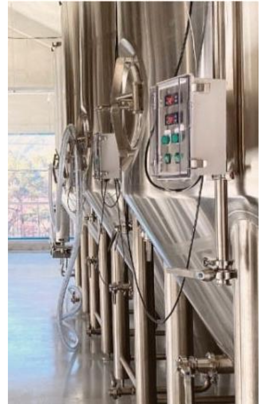
▲ 양조 시설