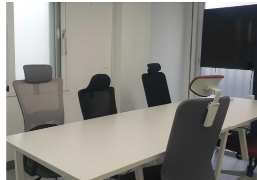
▲ 회의 공간