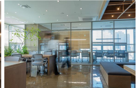
▲ 라운지 공간