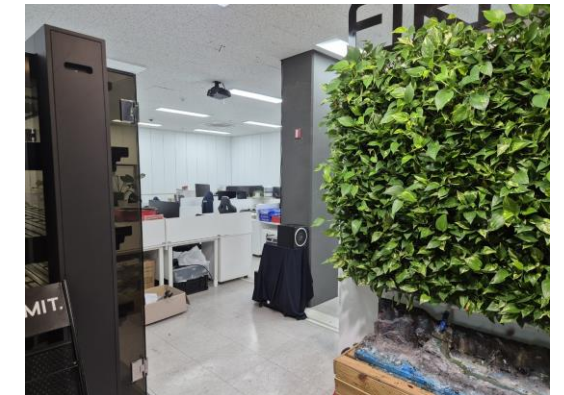
▲ 본사 사무실